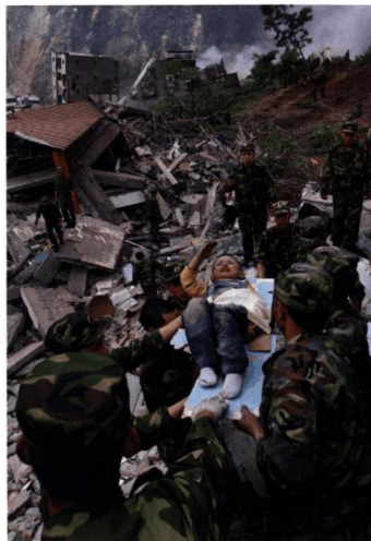
生命的敬礼（摄影）现代 杨卫华

人物的脸型有方形、圆形、三角形等，表情有喜怒哀乐等多种，发饰及穿戴往往表明其职业特点。